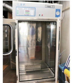
右)衣類ダメージを抑制できる乾燥機