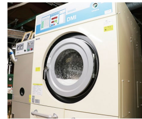
左)自動プログラムで法衣を洗浄するドライ洗濯機

極めて繊細な扱いを必要とする法衣洗濯において、実現困難であった自動化プログラムをメーカーと共同開発し、自動化洗浄のめどが立った。併せて乾燥・アイロン工程の時間短縮を実現し、全国からの法衣洗濯に応えられる体制が構築できた。